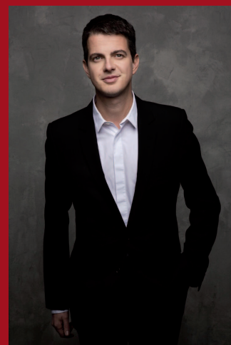
Philippe Jaroussky, Président Fondateur de l'Académie Musicale

C'est pour moi une formidable aventure qui commence et je suis très heureux de pouvoir intégrer avec mon académie ce nouveau temple dédié à la musique que sera La Seine Musicale, disposant de tous les moyens les plus modernes et stimulants pour de jeunes apprentis musiciens.