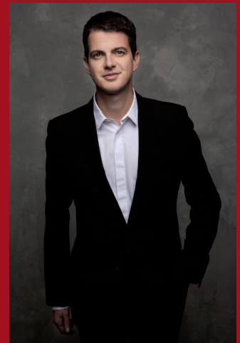
Philippe Jaroussky, Président Fondateur de l'Académie Musicale

C'est pour moi une formidable aventure qui commence et je suis très heureux de pouvoir intégrer avec mon académie ce nouveau temple dédié à la musique que sera La Seine Musicale, disposant de tous les moyens les plus modernes et stimulants pour de jeunes apprentis musiciens.