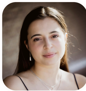
Léontine MARIDAT-ZIMMERLIN Mezzo-Soprano